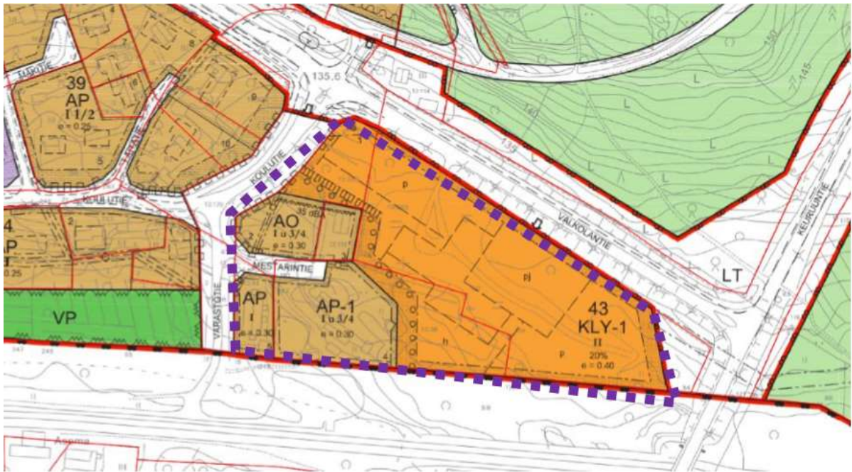
Kuva 1. Ote alueen kaavasta ja kiinteistörajat. Violetilla rajauksella on merkitty korttelin 43 muutosalue, joka nykyisellään on rakentamatonta.